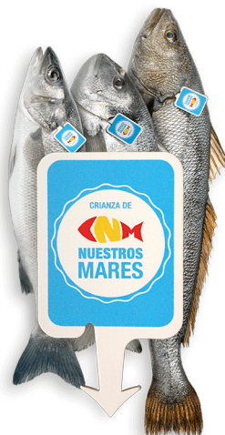
Imagen de los nuevos sellos: